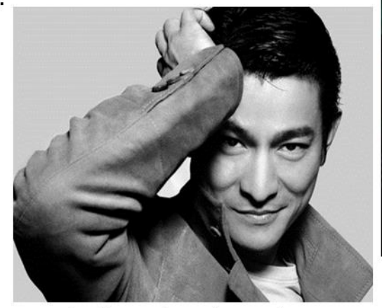
▲ 他被譽為粵語流行音樂的"四大天王" 之一 http://www.voguefish.com/tag/andy-lau-tak-wah/