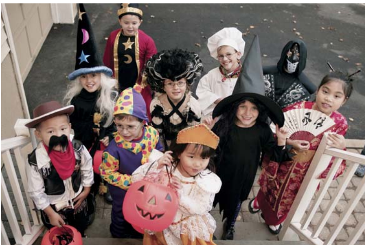
▲孩子們都會打扮成各種不同的鬼怪

如果你不想穿上那些駭人的行頭的呢，你就要用南瓜和骷髏裝飾你的房子喔！每當想起萬聖節，我就馬上聯想到讓人害怕的南瓜臉。在挖空的南瓜中放有一隻很光亮的蠟燭，這是因為以前的時候，人們利用南瓜的燈光和可怕的脸來消災和辟邪。