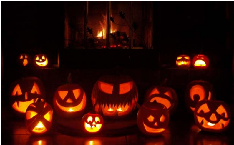
▲萬聖節特出的南瓜燈( http://2.bp.blogspot.com/-L_Ur1qBXmw8/Tq8EZpk7E9I/AAAAAAAAAWY/LPS0vv_gNAc/s1600/samhain+jack+o+lanterns+2010a.jpg )

萬聖節的時候有許多人會裝扮成不同的人，例如鬼、吸血鬼、狼人、骷髏和殭屍等等。你知道為什麼嗎？這是因為在古代有很多人穿上好像鬼似的行頭，用以欺騙那些鬼魂和邪魔。