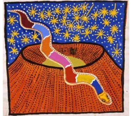
▲夢幻時光的彩虹蛇

澳大利亞有許多黃金時代的故事，他們也多有相同的主题。彩虹蛇非是常著名的和流行的土著繪畫。根據神話故事，它的命名是因為明顯的彩虹狀和一條蛇形的外觀。有學者說，蛇和彩虹之間的聯繫表明季節的循環，以及水在人類生活中的重要性。彩虹蛇是世界上最古老的宗教信仰之一，並且一直持續到今天，具有個文化的影響力。在澳洲的土著文化裡，彩虹蛇的故事已經存在了一段很長的時間，而且一代又一代的傳下來。在彩虹蛇的故事中最常見的傳說是蛇為萬物的創造者，為生命帶來一個廣闊的空間。有些文化認為，沒有蛇，將無法降雨，地球便會枯竭。而在其他文化裡，則認為蛇是要來阻止下雨的。在一些文化中，以為彩虹蛇是男性，而在其他文化中則是女性。彩虹蛇被認為是治療者，因為它與人體的血液有關。