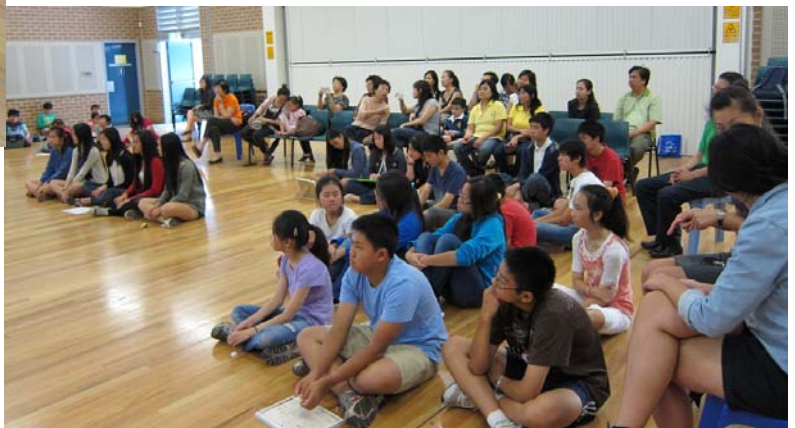
人家長們在場加油，鼓勵整年都在努力的學生們

各班的活動難度是依照學生的年級和程度來設計，從認識生字到造字、造詞，甚至考學生們的造句能力。