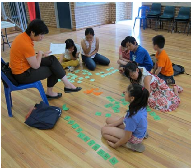
人二年級的同學們找字來造句

各班的活動難度是依照學生的年級和程度來設計，從認識生字到造字、造詞，甚至考學生們的造句能力。