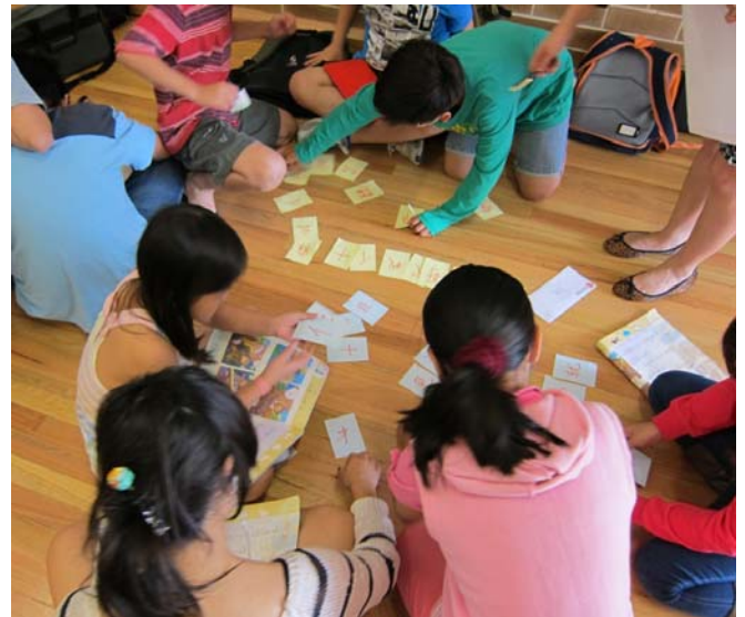
三年級玩湊字遊戲，湊完了還要造句！人

去年的結業典禮和往年的有一點不同。這次，除了幼兒班的朗誦和舞蹈，大班的同學們沒有表演節目，但需要把整年所學的中文用來挑戰老師們所派下的語文任務。