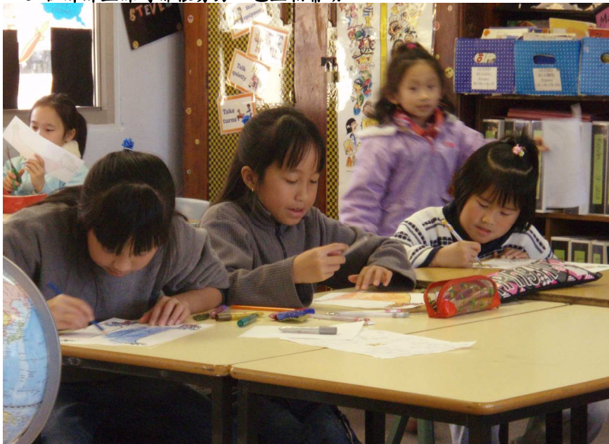
▼三位姊妹上課時都很努力，也互相幫助